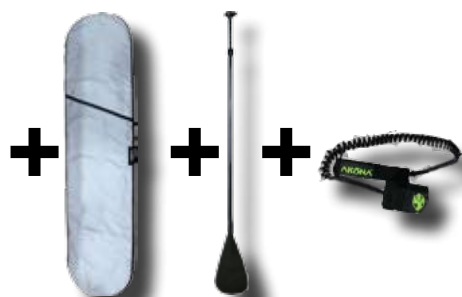
Sac Pagaie carbone Leash ajustable

Akona 2018 COLADA ou TRIP Ensemble complet