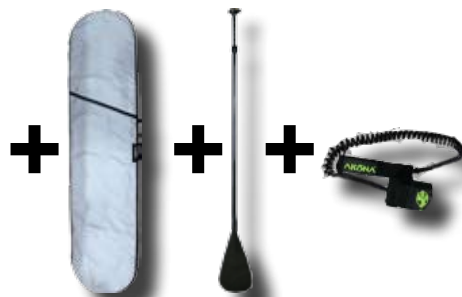
Sac Pagaie carbone Leash ajustable

Akona 2016 TIKI ou DIAMOND Ensemble complet