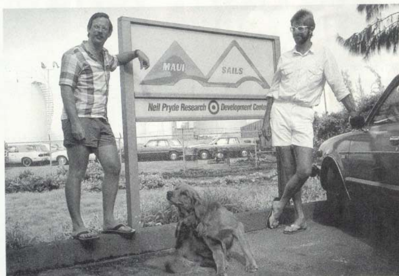
Nos compères devant le loft Maui Sail qui devient le centre de recherche Neil Pryde en octobre 1981. En bas, factures de voiles custom Maui Sail datées de 1980.