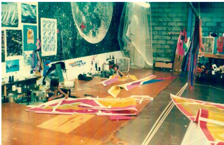
Développement de la voile R.A.F au loft du 111 Hana Highway en février 1984.